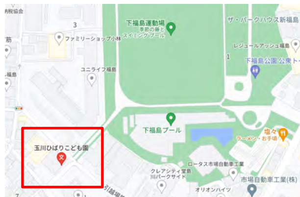
大阪市福島区玉川1丁目6-2