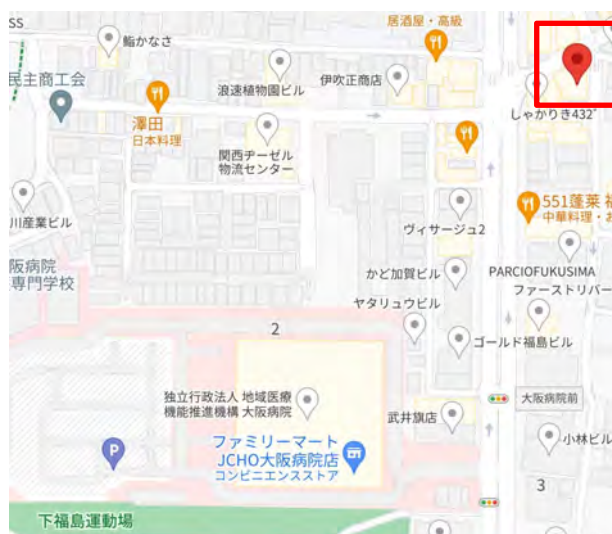
大阪市福島区福島3丁目6-20

※出発時刻の16:50に間に合わない場合は、保護者様と帯同して直接お越しください。